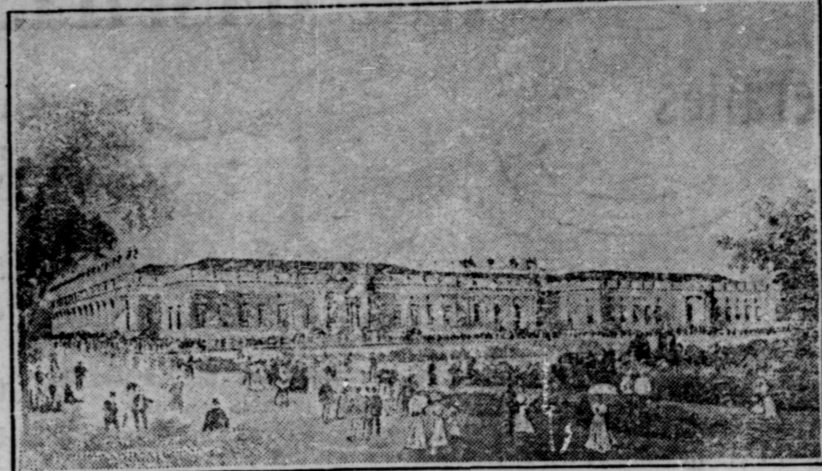
L'UNE DES BATISSES DE L'EXPOSITION

Adressez toutes vos lettres : CIE CHIMIQUE FRANCO-AMERICAINE, 274 rue Saint-Denis, Montréal.