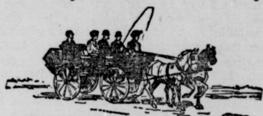
NEW PATIENTS ON WAY TO HOSPITAL

Not a single applicant has ever been refused admission to the Free Hospital because of his or her poverty.