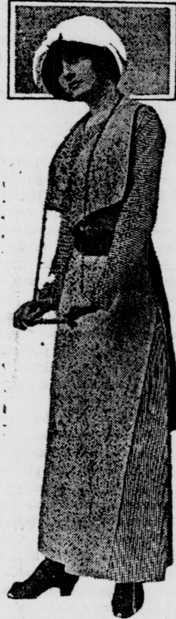
Un joli costume pour les petites sorties, et pour faire des visites.