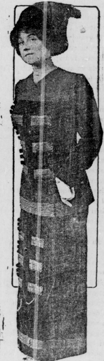
Un joli costume pour les petites sorties, et pour faire des visites.