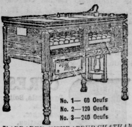
L'APPAREIL INCUBATEUR CHATHAM Ses succès ont encouragé une multitude à faire beaucoup plus d'argent qu'ils n'ont jamais pu en faire par d'autres méthodes.

L'Appareil Incubateur Chatham et Couveuse a toujours prouvé qu'il était un faiseur d'argent.