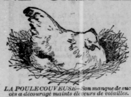
LA POULE COUVEUSE — Son manque de succès à décevoir maints éleveurs de volailles.

L'Appareil Incubateur Chatham et Couveuse a créé une nouvelle ère dans l'élevage des Volailles.