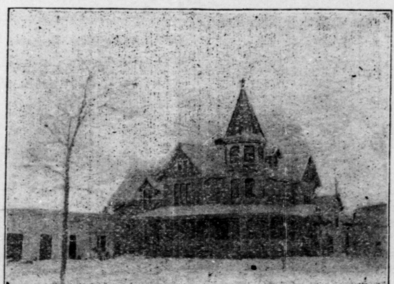
PRESBYTERE DU PERE BURKE