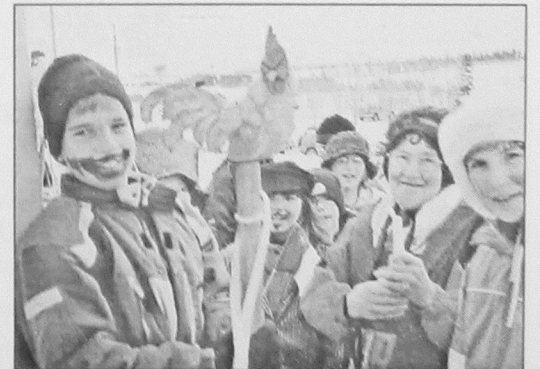
31. Élèves de Saint-Augustin et de l'École-sur-Mer, Rustico, 2004