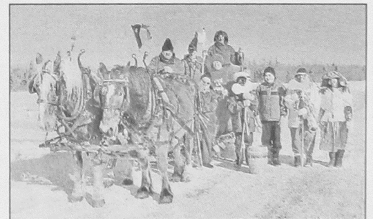
30. Jimmy Gallant aux cordeaux, St-Timothée, 2003