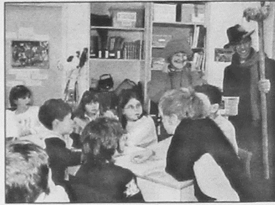
32. École-sur-Mer, Summerside, 2004 (Jonathan Beirsto)

leur reprend ses droits presque partout en Acadie de l'Île!