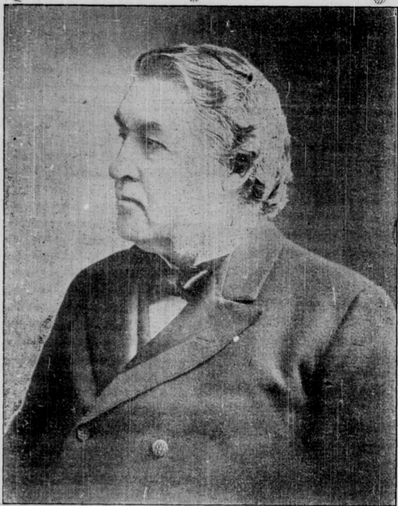
SIR CHARLES TUPPER.