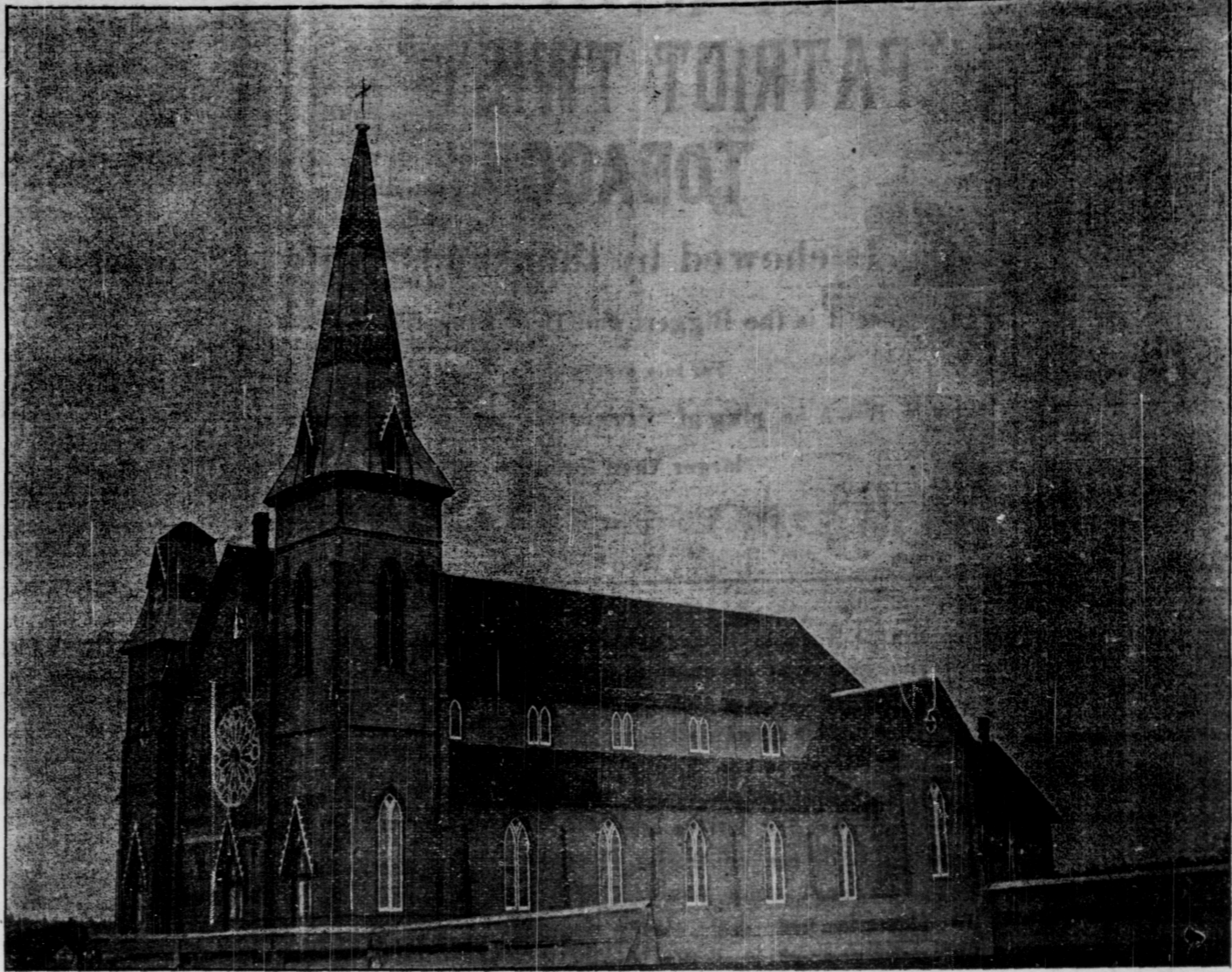
L'ÉGLISE DE L'IMMACULÉE CONCEPTION, PALMER ROAD.

Le fait est que beaucoup d'hommes politiques sont d'opinion que les élections générales auront lieu prochainement, au mois d'octobre peut-être ; et tout porte à la croire. Qui vivra verra.