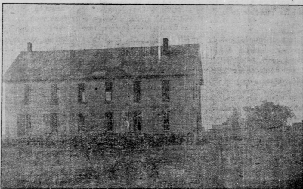
La Salle Ste-Marie, qui s'en va en ruine. La plus belle salle de la place si elle était soignée.