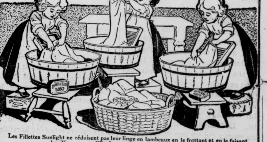
Les Fillettes Sunlight ne réduisent pas leur linge en lambeaux en le frottant et en le faisant bouillir . . . Elles lavent suivant la méthode Sunlight.