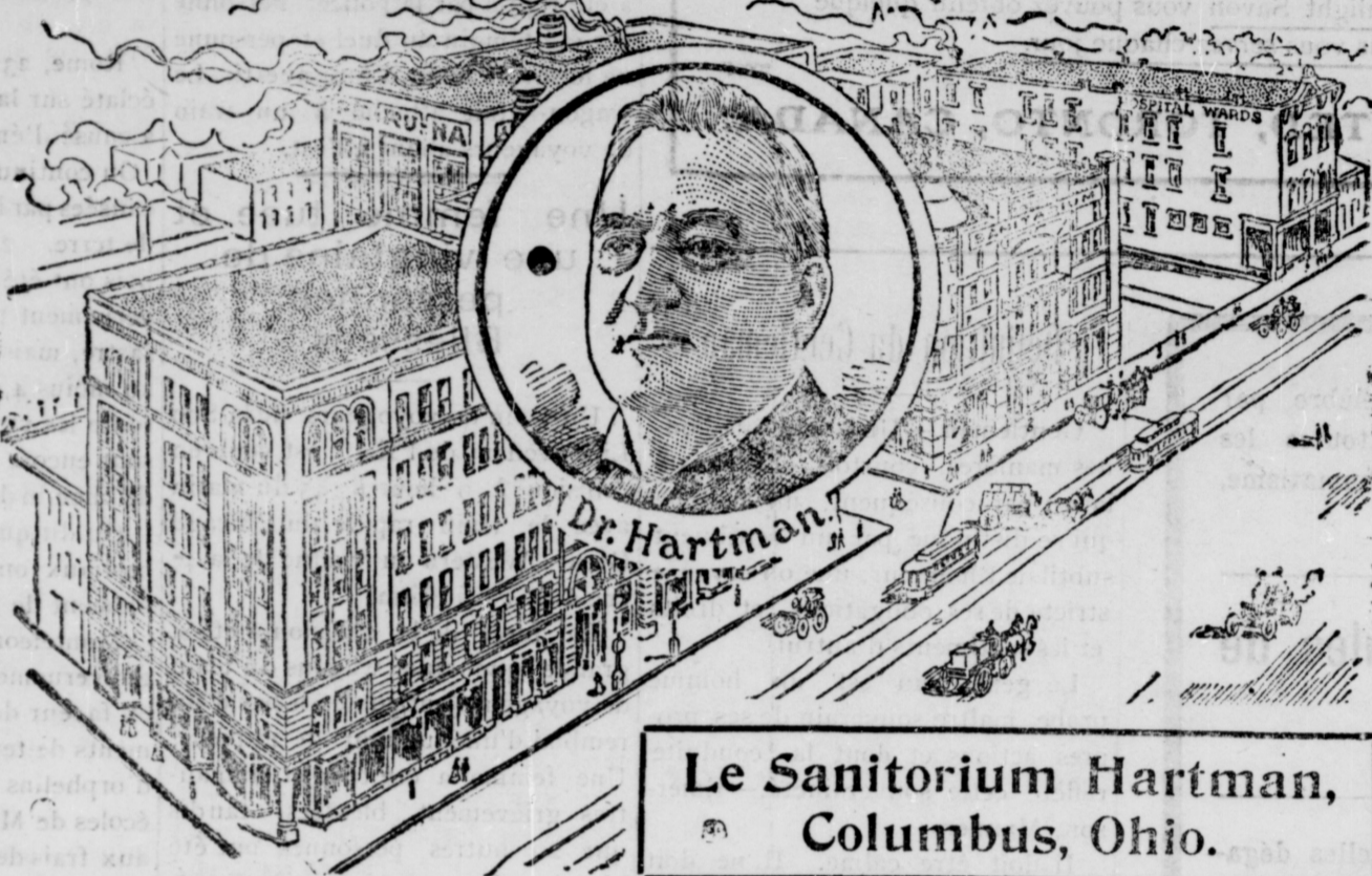
Le Sanitorium Hartman, Columbus, Ohio.