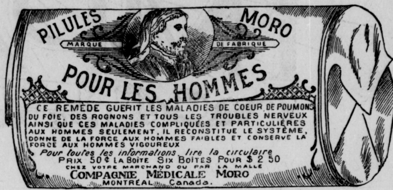
Fac-Simile exact d'une boîte de Pilules Moro.

Donnez-nous un homme brisé par les excès, la dissipation, un travail trop dur, les tracass, ou par toute autre cause qui ait sapé sa vitalité, avec les Pilules Moro nous le rendrons aussi vigoureux en tous points, que n'importe quel homme de son âge.