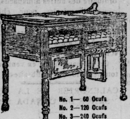
L'APPAREIL INCUBATEUR CHATHAM Ses succès ont encouragé une multitude à faire beaucoup plus d'argent qu'ils croyaient possible de faire avec des poulets.

Peu D'Espace Suffit à l'Élevage des Volailles.