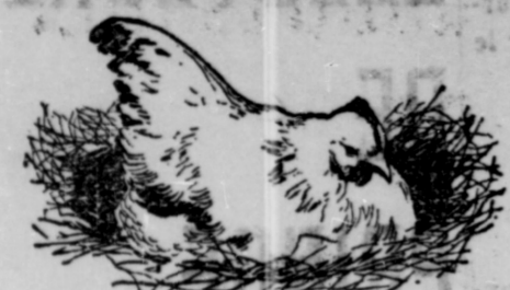
LA POULE COUVEUSE - Son marque de succès à découper mais éleveurs de volailles.

Vous pouvez faire de l'argent en élevant des poulets suivant la vraie méthode - en ferez abondamment.