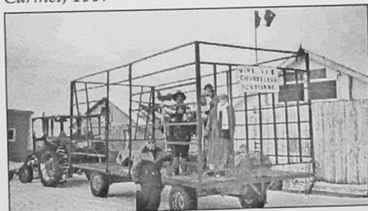
11. St-Chrysostome, 1997

I (687-701) institua officiellement la fête de la «Purification de la Vierge». La fête s'appelait pareillement en Angleterre avant la rupture avec Rome en 1534.