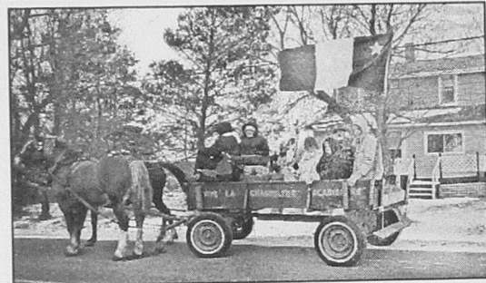
8. Abram-Village, 1996