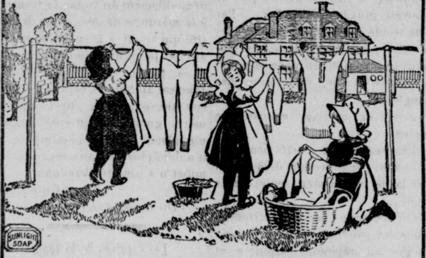
Les Fillettes Sunlight admirent les résultats produits par la méthode de laver suivant Sunlight.