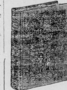
16mo, 144 pages; bound in linen, gilt top.

Hundreds of Hints on How to Make the Little Folks Happy Lists of Stories, Songs and Plays Invaluable to Mothers and Nurses