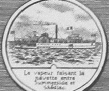
Le vapeur faisant la navette entre Summerside et Shédiac.