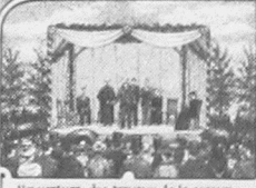
L'ouverture des travaux de la convention par le Président, l'hon. P.A. Landry. On y entend des discours éloquents et patriotiques prononcés par plusieurs personnes distinguées.