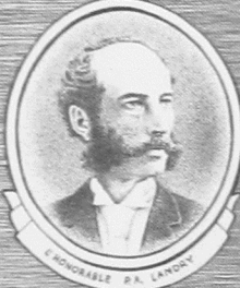
HONORABLE P.A. LANDRY