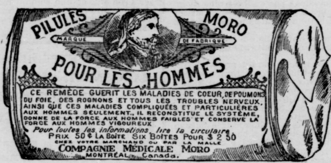
L'Etiquette est de papier blanc imprimé en bleu.

Fac-Simile exact d'une boîte de Pilules Moro.