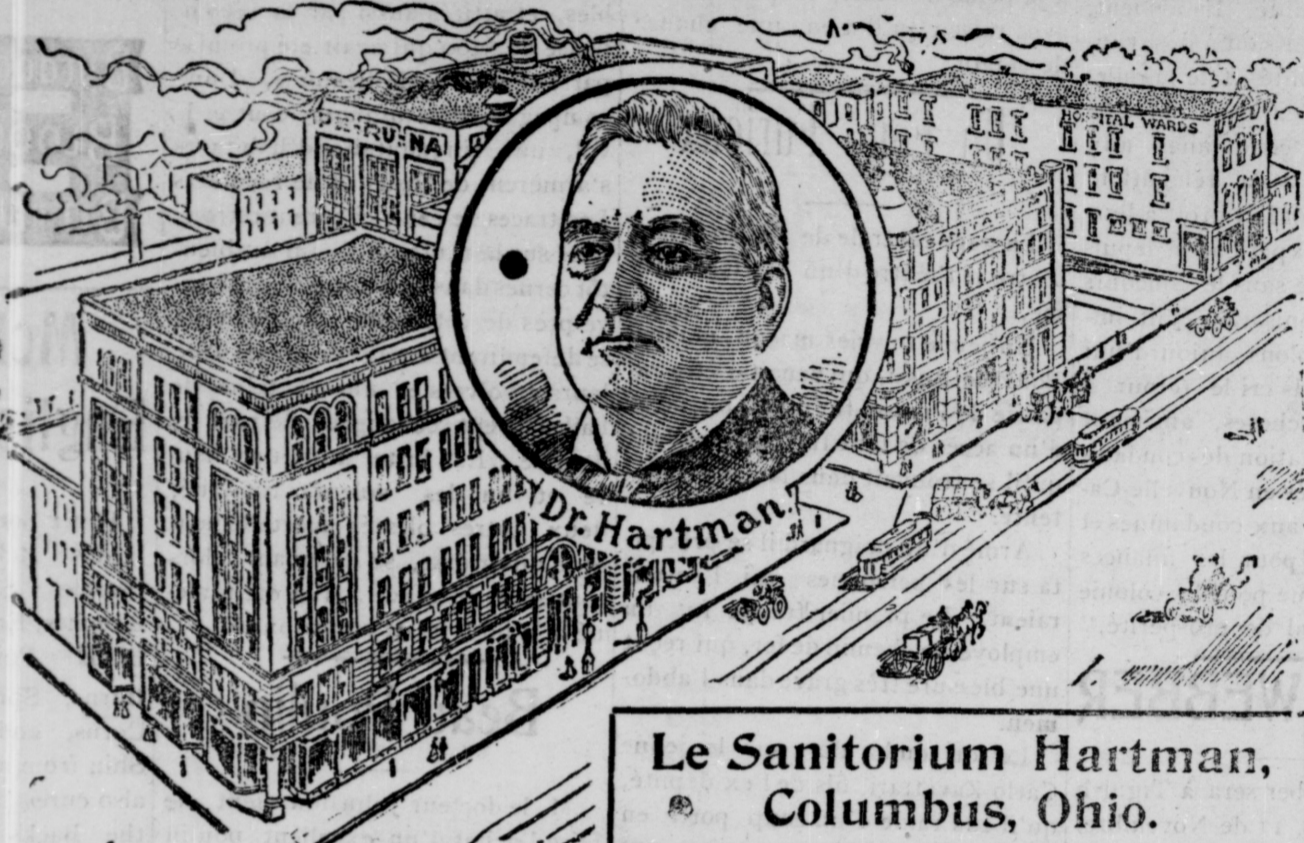
Le Sanitorium Hartman, Columbus, Ohio.