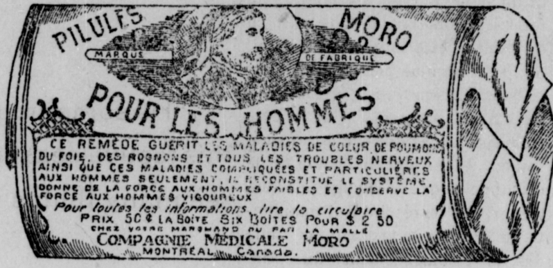
Fac-Simile exact d'une boîte de Pilules Moro.

Donnez-nous un homme brisé par les excès, la dissipation, un travail trop dur, les tracas, ou par toute autre cause qui ait sapé sa vitalité, avec les Pilules Moro nous le rendrons aussi vigoureux en tous points, que n'importe quel homme de son âge.