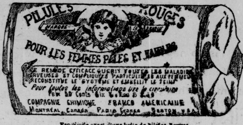
Fac-similé exact d'une boîte de Pilules Rouges.

Nos Pilules Rouges sont une spécialité pour les maladies des femmes seulement; c'est ce qui fait leur force et leur popularité. Il est impossible à un remède de guérir tous les maux.