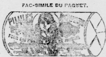
Le papier est blanc imprimé en encre rouge.

Nous attirons votre attention sur le fait très important que nous avons ratanché le nom du Dr. Coderre PILULES ROUGES de la CIE CHIMIQUE FRANCO-AMERICAINE. Pour le plus grand intérêt de nos patientes, nous avons cru faire ce changement, elles devront donc comme par le passé, et dans le futur, exiger que le nom de la CIE CHIMIQUE FRANCO-AMERICAINE, soit sur chaque boîte, c'est le seul moyen d'avoir les véritables PILULES ROUGES et de se garantir rapidement. Elles devront refuser comme imitation, toutes PILULES ROUGES vendues de porte en porte et sans ces étiquettes au 200 ou à 25c. la boîte.