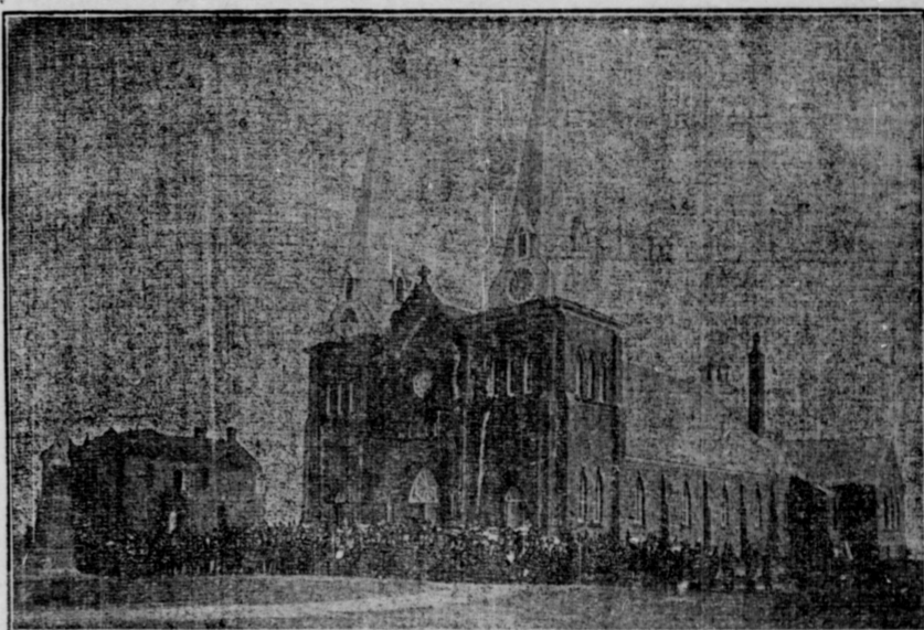
L'Eglise de Mont Carmel

Beaucoup de parents ont coutume de dépenser pour les enfants à l'époque des étrennes, des sommes qu'à un autre moment de l'année,