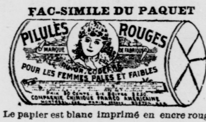
Le papier est blanc imprimé en encre rouge.

COMPAGNIE CHIMIQUE FRANCO-AMERICAINE, No 274 rue St Denis, Montréal.