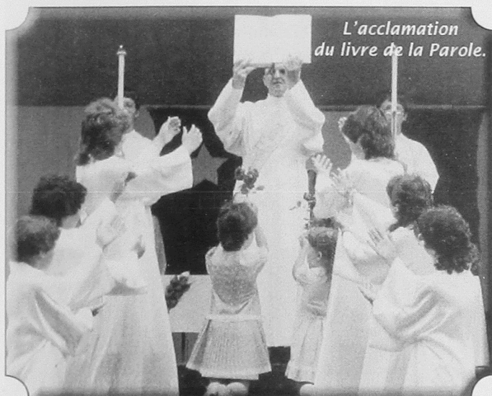
L'acclamation du livre de la Parole.

Les cérémonies officielles qui débutèrent à 15 h 15 furent, elles aussi, enregistrées pour faire partie d'une émission