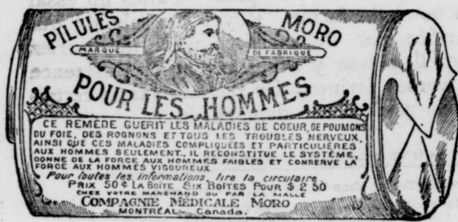
L'Étiquette est de papier blanc imprimé en bleu.

Fac-Simile exact d'une boîte de Pilules Moro.