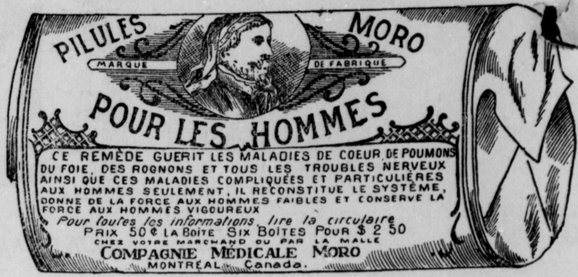
Fac-Smile exact d'une boîte de Pilules Moro.

Donnez-nous un homme brisé par les excès, la dissipation, un travail trop dur, les tracas, ou par toute autre cause qui ait sapé sa vitalité, avec les Pilules Moro nous le rendrons aussi vigoureux en tous points, que n'importe quel homme de son âge.