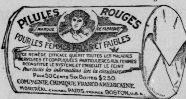
L'Etiquette est de papier blanc imprimé en rouge.

COMPAGNIE CHIMIQUE FRANCO-AMERICAINE, 274, rue St-Denis, Montréal.