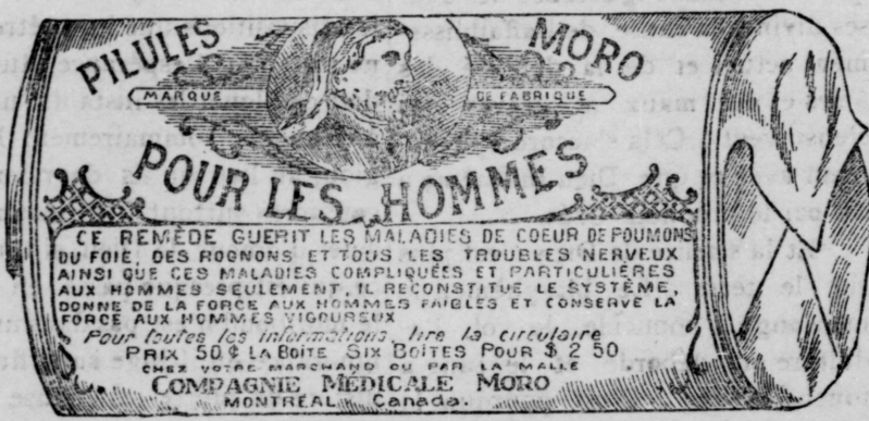
Prix exact d'une boîte de Pilules Moro.

Donnez-nous un homme brisé par les excès, la dissipation, un travail trop dur, les tracas, ou par toute autre cause qui ait sapé sa vitalité, avec les Pilules Moro nous le rendrons aussi vigoureux en tous points, que n'importe quel homme de son âge.