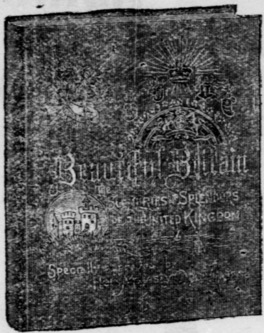
Large quarto volume (11 1/2 x 13 1/2 ins.), 36 pages. Extra-embossed paper. Extra English cloth, emblematic embossing in ink and gold.

The Scenery and the Splendors of the United Kingdom.