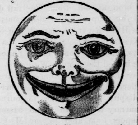
Will be wreathed with a most engaging smile, after you invest in a