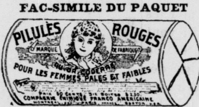
Le papier est blanc imprimé en encre rouge.

Les véritables Pilules Rouges, pour les Femmes Pâles et Faibles, sont toujours vendues en boîtes contenant 50 PILULES ROUGES, jamais autrement.—Si votre marchand ne les a pas, envoyez-nous, par la maille, 50c en timbres pour une boîte, ou $2.50 pour six boîtes.