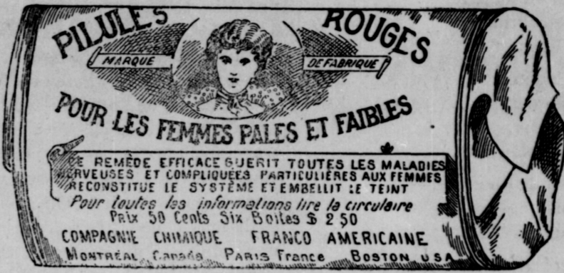
Fac-similé exact d'une boîte de Pilules Rouges.

Nos Pilules Rouges sont une spécialité pour les maladies des femmes seulement; c'est ce qui fait leur force et leur popularité. Il est impossible à un remède de guérir tous les maux. Jamais, dans l'histoire de la médecine, un remède n'a obtenu autant de guérisons que nos Pilules Rouges. Nous demandons à nos nombreuses clientes de ne pas comparer nos Pilules Rouges aux autres remèdes guérissant tous les maux, entre autres, aux remèdes liquides qui ne doivent leur effet stimulant qu'à l'alcool qu'ils renferment.