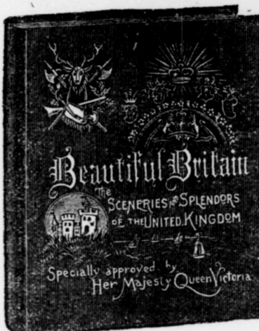
Large quarto volume (11 1/2 x 13 1/2 ins.), 356 pages. Extra enameled paper. Extra English cloth, emblematic embossing in ink and gold.