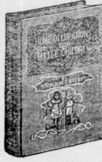
16mo, 144 pages; bound in linen, gilt top.

Hundreds of Hints on How to Make the Little Folks Happy Lists of Stories, Songs and Plays Invaluable to Mothers and Nurses