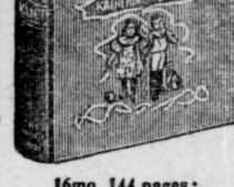
Home, 144 pages; bound in linen, gilt top.

Home Occupations for Little Children By KATHERINE BEEBE.