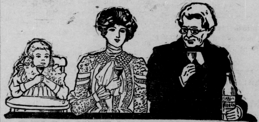
Le "Vin des Carmes" comme la Santé aux jeunes et aux Vieillards.

En vente partout A. TOUSSAINT & C ie , Seuls Dépositaires.