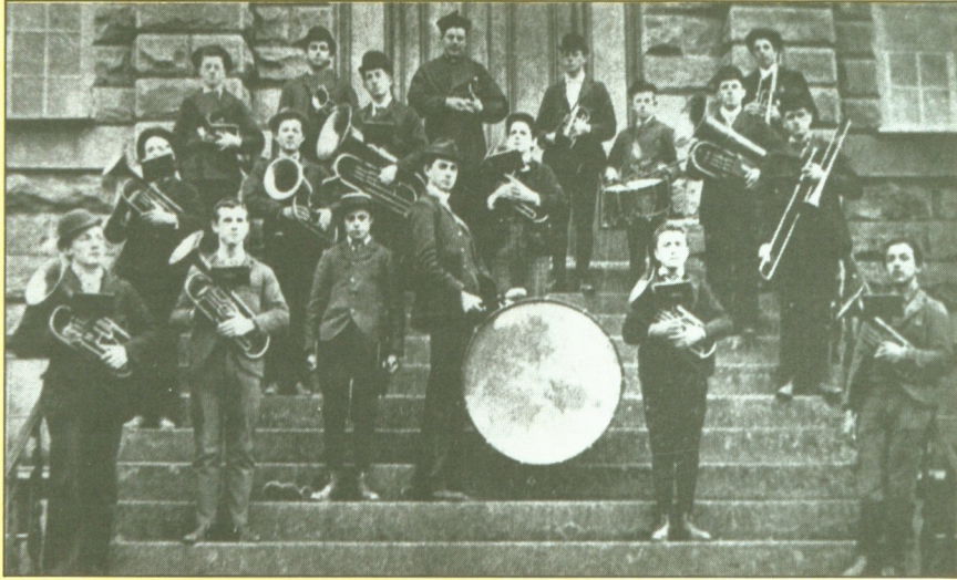
La fanfare du Collège Saint-Joseph en 1893.