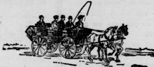
NEW PATIENTS ON WAY TO HOSPITAL

Not a single applicant has ever been refused admission to the Free Hospital because of his or her poverty,