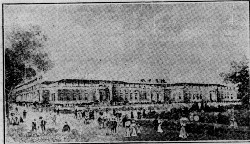
L'UNE DES BATISSE DE L'EXPOSITION