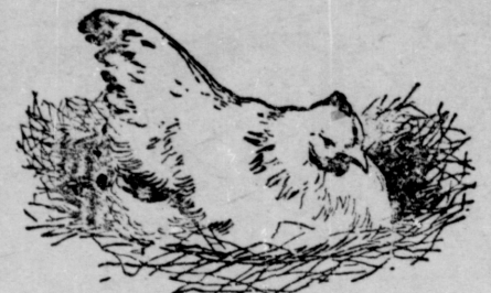
LA POULE COUVEUSE.—Son manque de succès à décourager maints éleveurs de volailles.

Vous pouvez faire de l'argent en élevant des poulets suivant la vraie méthode—en ferrez abondamment.