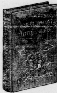
16mo, 144 pages; bound in linen, gilt top.