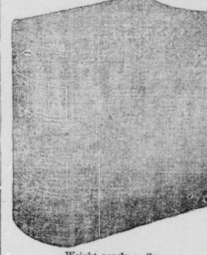
Weight nearly 25 lbs. Size 8 1/2 x 10 1/2 x 4 inches. Full Sheep or Half Russia. With Dennison's Patent Index 25c. extra.