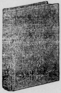
16mo, 144 pages; bound in linen, gilt top.

Hundreds of Hints on How to Make the Little Folks Happy Lists of Stories, Songs and Plays Invaluable to Mothers and Nurses