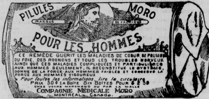
Fac-similé exact d'une boîte de Pilules Moro.

Donnez-nous un homme brisé par les excès, la dissipation, un travail trop dur, les tracass, ou par toute autre cause qui ait sapé sa vitalité, avec les Pilules Moro nous le rendrons aussi vigoureux en tous points, que n'importe quel homme de son âge.