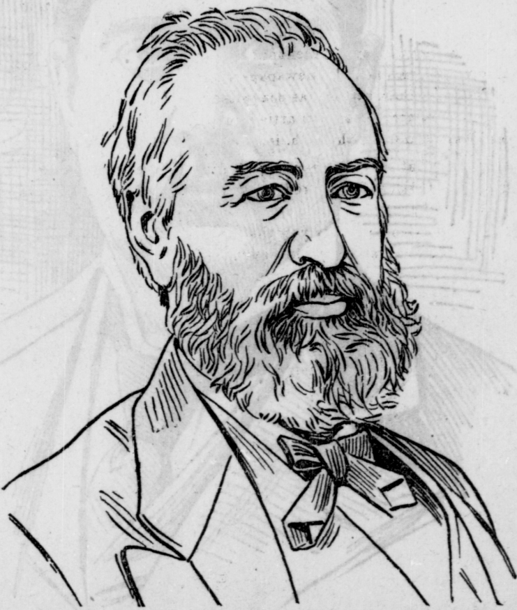
L'HON. SENATEUR DE BOUCHERVILLE, Président honoraire de l'organisation conservatrice de la province de Québec.