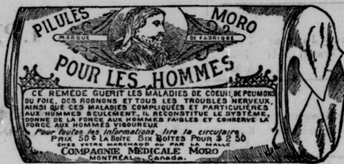
L'Etiquette est de papier blanc imprimé en bleu.

Fac-Simile exact d'une boîte de Pilules Moro.