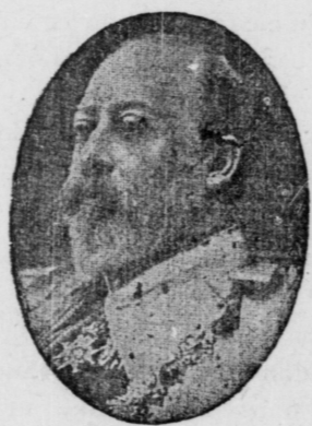
Illustrations de feu le roi Edouard.

Le remède ? Pour les personnes adonnées à la boisson, la fuite des occasions ; pour celles qui n'ont pas encore trempé la lèvre à la coupe traîtresse, la ferme résolution de ne jamais le faire. Quiconque a bu boira, dit un proverbe, hélas ! trop vrai. Peine perdue que de vouloir enrégimenter les ivrognes dans l'armée des sobres. Mieux vaut la convergence de toutes les énergies à préserver de la contamination la génération qui pousse. C'est une oeuvre d'éducation qu'il faut faire, tant à l'école qu'au foyer. Trop souvent, l'enfant apprend à considérer l'alcool comme un merveilleux talisman, l'adolescent grandit sous l'impression que "prendre un coup", c'est une action virile, le peuple croit que toute fête serait monotone sans le cliquetis des verres... Il est temps de mettre fin à ces dangers préjugés. Par eux règne l'alcool. Et ce règne est en même temps celui de la paresse intellectuelle, de l'avachissement politique, de la déchéance morale, du malaise social, de la ruine religieuse.