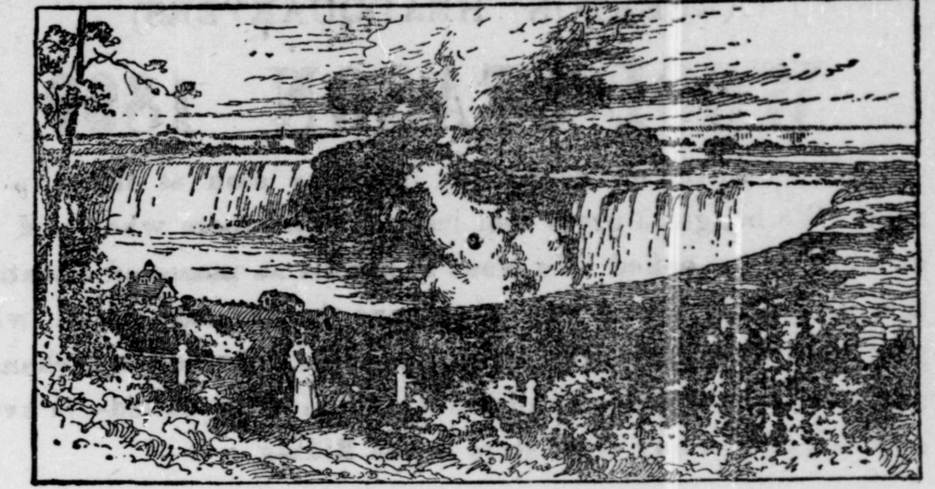
This cut illustrates but very faintly the magnificence of the original.

There are only a few copies of this magnificent art work left and you will be fortunate indeed if you secure one.