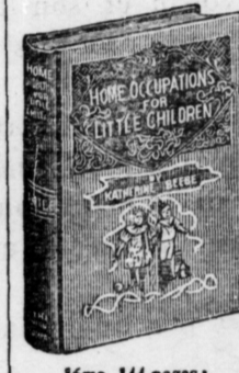
16mo, 144 pages; bound in linen, gilt top.

Hundreds of Hints on How to Make the Little Folks Happy Lists of Stories, Songs and Plays Invaluable to Mothers and Nurses