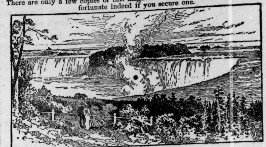
This cut illustrates but very faintly the magnificence of the original. The above reproduction is less than one-fiftieth the actual size, the engraved surface being 40 x 16 1/2 inches, printed on heavy plate paper for framing. Actual size of picture 4 1/2 x 27 inches. The publisher's price is $25.00, unframed, and that is what a copy would cost you in the art stores. It is a work that would grace the walls of the most palatial mansion in the land.

There are only a few copies of this magnificent art work left and you will be fortunate indeed if you secure one.