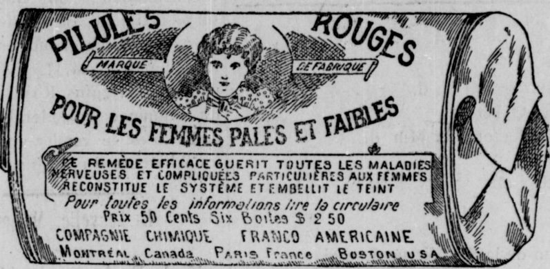
Fac-similé exact d'une boîte de Pilules Rouges.

Nos Pilules Rouges sont une spécialité pour les maladies des femmes seulement ; c'est ce qui fait leur force et leur popularité. Il est impossible à un remède de guérir tous les maux. Jamais, dans l'histoire de la médecine, un remède n'a obtenu autant de guérisons que nos Pilules Rouges. Nous demandons à nos nombreuses clientes de ne pas comparer nos Pilules Rouges aux autres remèdes guérissant tous les maux, entre autres, aux remèdes liquides qui ne doivent leur effet stimulant qu'à l'alcool qu'ils renferment.