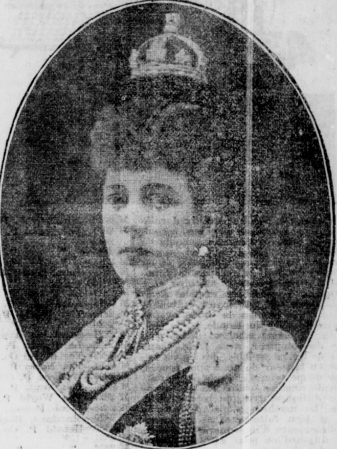
SA MAJESTÉ LA REINE ALEXANDRA