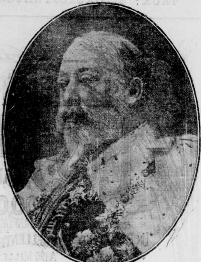
SA MAJESTÉ LE ROI EDOUARD VII.

La conférence coloniale à Londres doit commencer aujourd'hui ses délibérations. Le bureau colonial soumet à l'étude les questions suivantes: Relations politiques de l'Angleterre avec ses colonies; la défense impériale; les relations commerciales de l'Empire; les relations de l'Australie et de la Nouvelle Zélande avec les îles du Pacifique.