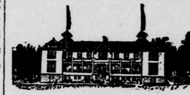
MUSKOKA FREE HOSPITAL FOR CONSUMPTIVES. MAIN BUILDING FOR PATIENTS.

A national institution that accepts patients from all parts of Canada. Here is one of hundreds of letters being received daily:—